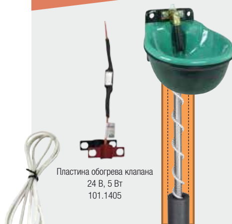
Пластина обогрева клапана 24 В, 5 Вт 101.1405

Морозостойкость до -35°C при установке обогрева клапана!